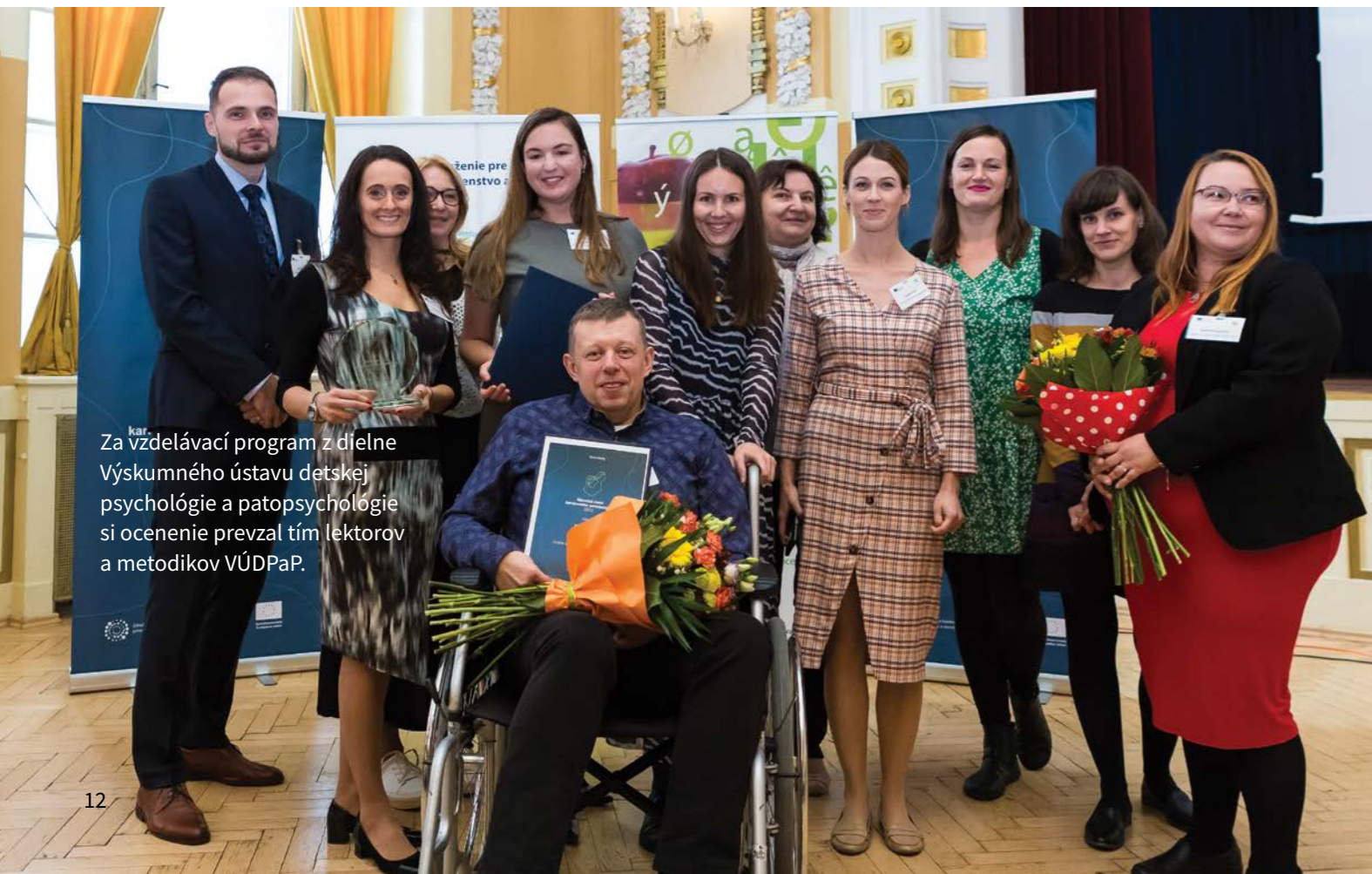
Za vzdelávací program z dielne Výskumného ústavu detskej psychológie a patopsychológie si ocenenie prevzal tím lektorov a metodikov VÚDPaP.